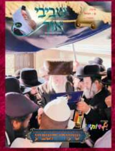
מורינו הרב השבוע בחופה השבוע