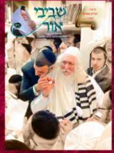
מורינו הרב בסעודה שלישית שבת חוה"מ פסח