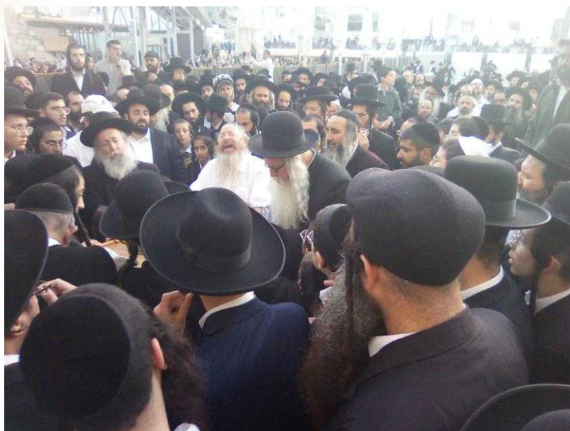
עצרת אלפים לרפואת מורינו הרב בכותל המערבי

אָדָם, אַף אַחַד לֹא יָדַע, שׁוֹאֲלִים אִם יוֹדְעִים, שׁוֹאֲלִים אֶת הַמְּלָחִים.