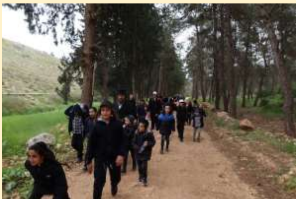
בינות לעצי היער – על יד מודיעין – טיול מספר 11