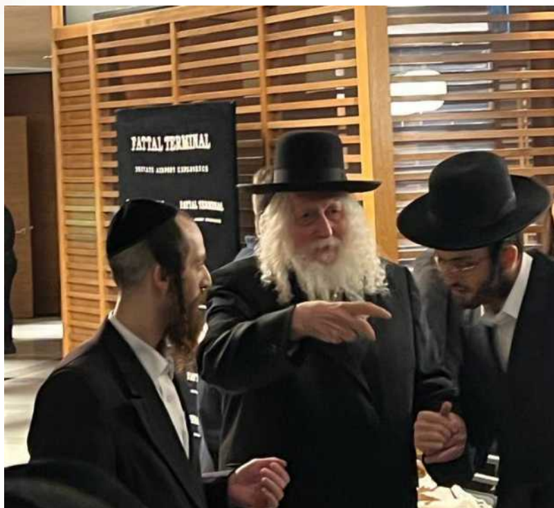
מורינו הרב בחזרתו לארץ מהונגריה מוצאי צום גדליה

המַרְבֵּה, המוֹעֵט מַחְזִיק אֶת המַרְבֵּה, תְּמִיד הַמְעֵט מַחְזִיק אֶת המַרְבֵּה, הַמְעֵט — הוּא מַחְזִיק אֶת הַמַּרְבֵּה, אֲפָשֶׁר גַּם לְהַגִּיעַ מֵאֵה אֶלֶף אִישׁ.