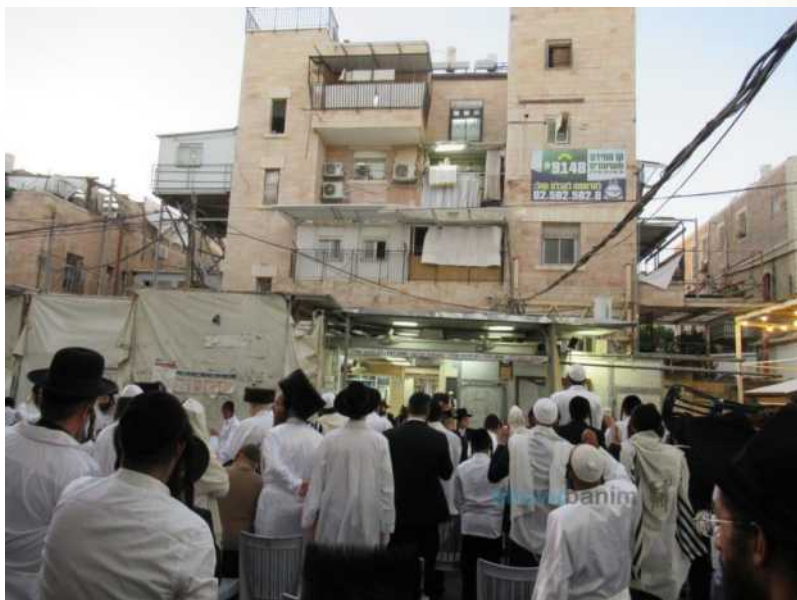
מוזינו הרב במנחה של ערב ראש השנה

חסכים... ילד עשוק ורצוץ... "והיית רק עשוק ורצוץ כל הימים" (דברים כח, לג).