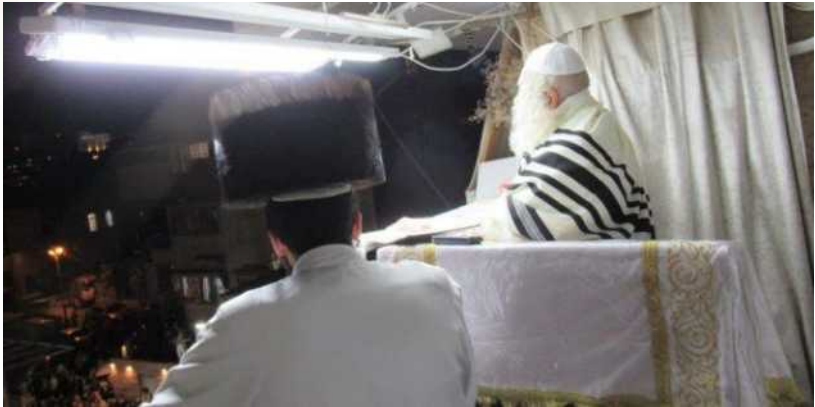
הגה"צ רבי אליעזר ברלנד שליט"א בתפילת ערבית מוצאי ראש השנה תשפ"ד

"וְהוּא נֵעַר" (שם לז, ב), "וְנִהַר יֵצֵא מֵעֵדֶן לְהִשְׁקוֹת אֶת הַגֶּן" (שם ב, י), "עַל נְהַר כְּבָר" (יחזקאל א, א), "כְּבָר" זֶה הַנְּהַר יוֹצֵא מֵעֵדֶן, זֶה הַפִּישׁוֹן, הוּא יוֹצֵא מֵעֵדֶן לְהִשְׁקוֹת אֶת הַגֶּן, הוּא הַנְּהַר שֶׁהוּא מְשַׁקֶּה אֶת הַגֶּן, וְ[–] לְוֵיתָן.