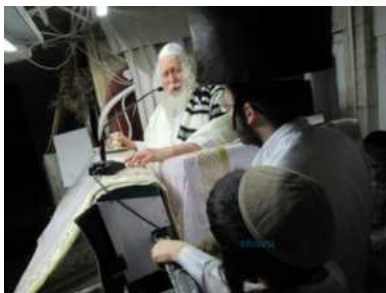
שלש... אז עשו נסיונות.

מִשָּׁה, רוֹצֵה לְהִיּוֹת כְּמוֹ מֹשֶׁה [אמר לו ה':] מִשָּׁה אֲתָה לֹא תוּכַל לְהִיּוֹת, אֲפֹלוּ אִם תִּצְוֶה מְלִיאָרְד שָׁנָה לֹא תוּכַל, מְלִיאָרְד פֶּעַם, אִי אֲפֹשֶׁר לְהִיּוֹת מֹשֶׁה, לַעֲשׂוֹת כְּאַלֶּה תִּפְלִיז וְצִיצִית. קָרַח אוֹמֵר: מַה זֶה הַחוּט הַזֶּה, קִמְצָן, פְּשׁוּט קִמְצָן, [נראה שמרמז לעניין המובא במדרש, שקורח אמר שהוא לא יטיל חוט אחד של תכלת אלא יעשה טלית שכולה תכלת, ומשה אמר שאינה כשרה, ולגלג על זה קרח].