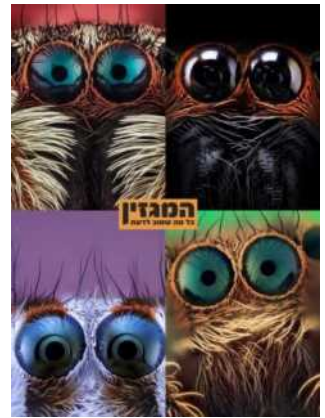
צילום מאקרו של עיני עכביש