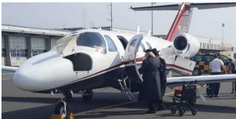
רבי אליעזר ברלנד שליט"א בעלייתו למטוס בחזרה לארץ הקודש שם ישהה בראש השנה