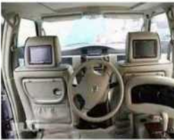
פתחו רכב שמועד לאותו אחד שיושב מאחור ומייעץ לך איך לנהוג נכון..