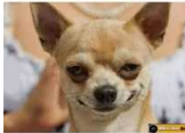
ואתה יודע שהוא משקר אבל אתה ממשיך לשמוע