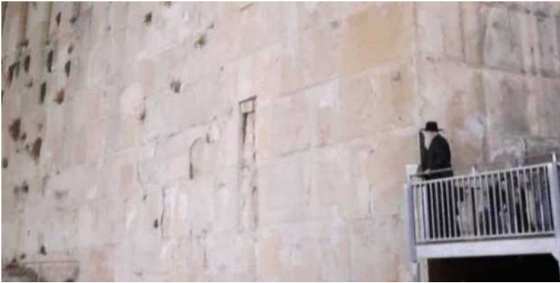
זכור ברית אברהם • מורינו הרב שליט"א בליל זכור ברית במערת המכפלה