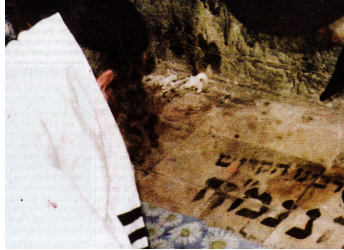
הרב שליט"א משתתף על הציון הק' בימים ההם

ב' אלפים-שצ"ה ) זה סיפרו שני אברכים שהיו לפני כשנתיים בארה"ב והרה"צ רי"פ זצ"ל כבר היה חלש מאוד והיה שוכב במטה בחלישות כח והאברכים הנ"ל נכנסו אצלו ואמרו שהם תלמידי הרב שליט"א - וכששמע זאת נכנס לו חיות עצום וכאילו נעשה צעיר בעשרים שנה וירד מהמטה וטרח לסדר לחם חדר להתאכסן שם ועלה במעלית לקומה העליונה עם צרור מפתחות ופתח דלתות בכמה חדרים עד שמצא להם חדר שיתאכסנו שם, ואח"כ בסעודת שב"ק כל הזמן דיבר בחיות עצום מהרב שליט"א וסיפר להם כאן במקום הזה ישב הרב שליט"א ולמד בהתמדה עצומה שמונה עשרה שעות ברציפות.