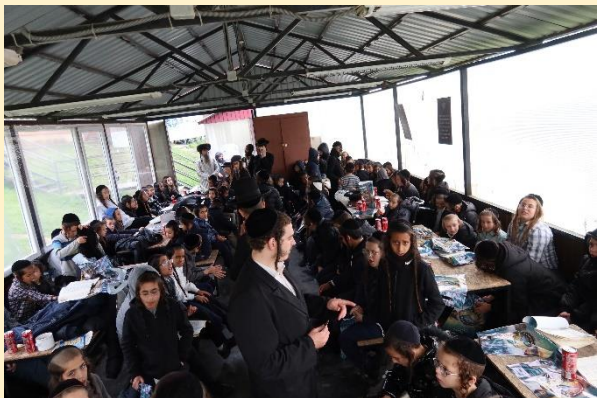
תפילות ברציפות - בציון רבינו הקדוש - ערב ראש השנה תשפ"ג