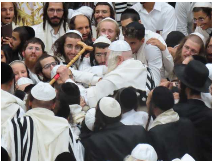
מורינו הרב במוצאי יום כיפור

לִילָה שְׁעָרְפָּה עֹזְבָה אֶת נַעְמֵי אֹז היא יִרְדָּה מִטָּה מִטָּה, אֹז היא נִפְגְּשָׁה עִם כָּלֵב וְהִסְתּוֹבְכָה עִם כָּלֵב, אֹז היא 'זִכְתָּה' לֵהְיוֹת בְּעֶצְמָה כָּלֵב.