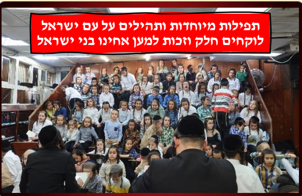
תפילות מיוחדות ותהילים על עם ישראל לוקחים חלק וזכות למען אחינו בני ישראל