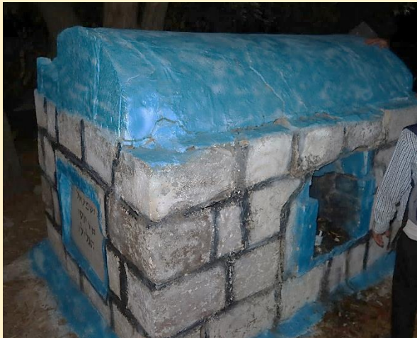
בקר ר' ישמעאל בן ר' יוסי הגלילי - אב תשפ"ג