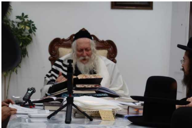
בשיעור ל'מפעל התורה יום חמישי בראשית

אֹתָם. הוּא אֹמֵר: לֹא, "אָרוּר אָפֶס כִּי עָז וְעִבְרָתָם כִּי קִשְׁתָּהּ" (בְּרֵאשִׁית מ"ט, ז), אֵיזָה קְלָלוֹת, ה' יְרַחֵם עָלֵינוּ. עֲכָשׂוּ אֲנַחְנוּ כְּכֹר בְּ"וֹזֵאת הַבְּרָכָה", אֵיזָה קְלָלוֹת — "אָרוּר אָפֶס כִּי עָז וְעִבְרָתָם כִּי קִשְׁתָּהּ אַחְלָקָם בִּיעֲקֹב וְאֶפִּיצֵם בְּיִשְׂרָאֵל" — אַז הֵם לֹא קִבְּלוּ נִחְלָה, לֹא שִׁמְעוֹן קִבֵּל נִחְלָה וְלֹא לְוִי קִבֵּל נִחְלָה, לְוִי מְקַבֵּץ עַל הַגְּרָנוֹת וְשִׁמְעוֹן קִבֵּל חֵלֶק בְּתוֹךְ נִחְלַת יְהוּדָה, אֵינן לוֹ נִחְלָה עֲצָמָאית, אֵינן נִחְלַת שִׁמְעוֹן, הַכֹּל [מִמֶּה שֶׁאָמַר לָהֶם אַבְיָהִם]: "אַחְלָקָם בִּיעֲקֹב וְאֶפִּיצֵם בְּיִשְׂרָאֵל", הַרְגָתָם עִיר שְׁלֵמָה, מַה זֶה כָּאֵן?