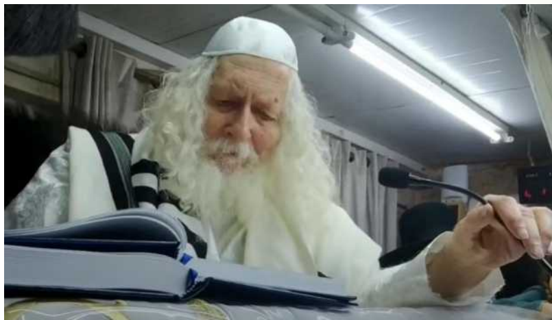
בסיום הש"ס אחר מעריב בליל יארצייט רבינו הק' ג' דחול המועד תשרי

המחלוקות שבין האחים ליוסף זה יש פה איזה מאה אפשרויות. אם חלקו בדרבנן ודאורייתא. אם חלקו ב"ולפני עור". וכל מיני אפשרויות, אם ב"בן פקועה". אם בעוף, שלפי הרמב"ם עוף אין בזה אבר מן החי, אם זה בדיעבד או לכתחלה, אם מתר לכתחלה. כל מיני אפשרויות יש כאן, כל מיני אפשרויות, איזה מאה אפשרויות במה האחים חלקו על יוסף. שהאחים באו למכר את יוסף, הם עשו הכל על פי דין, כל זה מסביר האור החיים הקדוש, שהם החרימו את השכינה, השכינה היתה אתם, אמרו: יש לו דין רוידיף, והוא חיב מיתה. הרמב"ם אומר שאבר מן החי זה אפלו כל שהוא, אנחנו יודעים שיש דין של כזית, אבל אצל גוים — בן נח אין דין של כזית, אפלו אכל כל שהוא — הוא חיב מיתה. אם אדם (גוי) רואה שגוי אוכל אבר מן החי אז