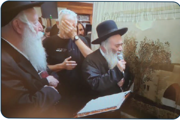
עם ישראל מתעורר למצוות ולשמירת שבת: תפילה בציון רחל אמנו בעקבות המצב

שם התוכנית היא 'שבת ברזל', כאשר לדברי היוזמים יש בכוח שבת