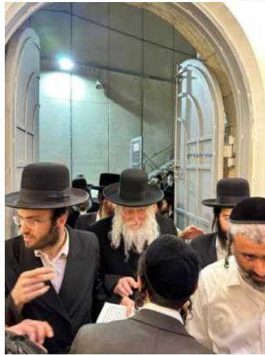
מניע לקבר רחל אימנו

הַרְדֵּב 1 כּוֹתֵב בְּסִימָן מ' שְׁשׁוּבוּיִים יוֹתֵר גְּרוּעַ מִמּוֹת 2 , כִּי אֵי אֶפְשָׁר לְדַעַת אֶת מִי מְעַנִּים, אֶת הַחֵילִים בְּטַח מְעַנִּים בְּעֵנִיִּים נוֹרְאִים.