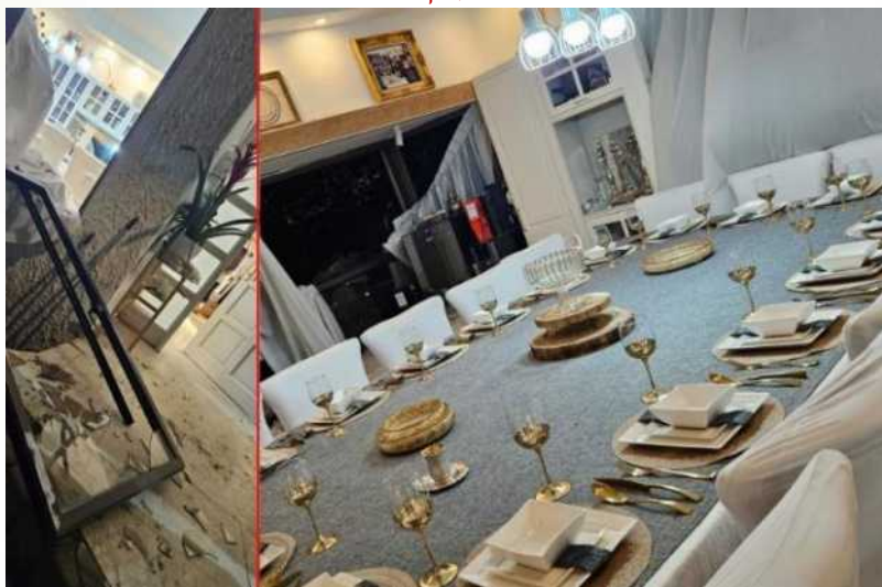
מצד ימין: השולחן שבת שלא ניווק. מצד שמאל: הבית הפגוע

רביעי. כִּמָּה שְׁאָדָם מִכִּין שְׁלַחַן שְׁבֵת יוֹתֵר מִקֶּדָם אִז הוּא כְּבֹר הַמְתִּיק אֶת הַכֹּל !