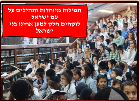
תפילות מיוחדות ותהילים על עם ישראל לוקחים חלק למען אחינו בני ישראל