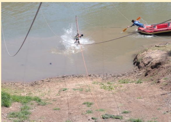
בנהר הירדן – טיול מספר 11 - תשפ"ג