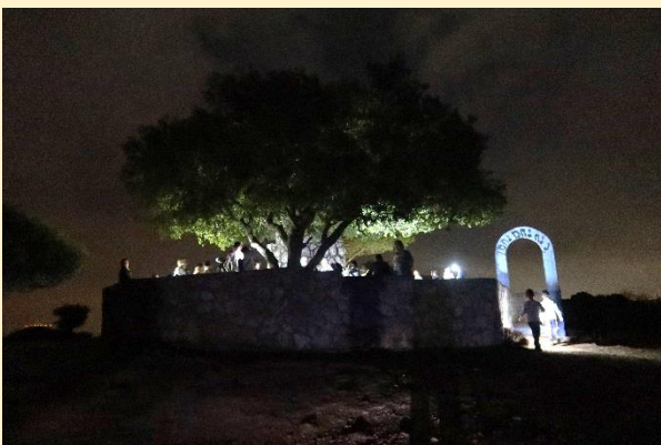
ציון ר' יהודה בן תימא – טיול מספר 13