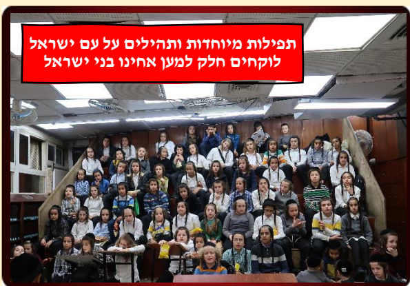
תפילות מיוחדות ותהילים על עם ישראל לוקחים חלק למען אחינו בני ישראל