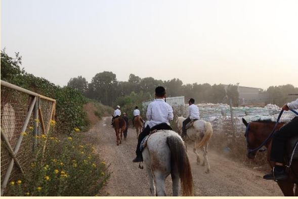
טיול מספר 9 – ל' תשרי תשפ"ג