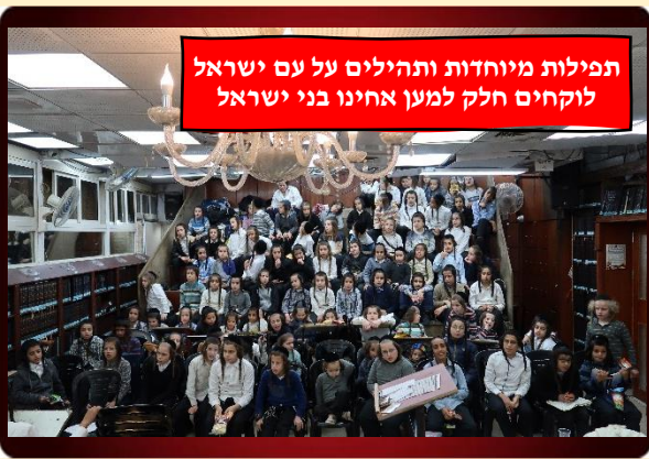
תפילות מיוחדות ותהילים על עם ישראל לוקחים חלק למען אחינו בני ישראל