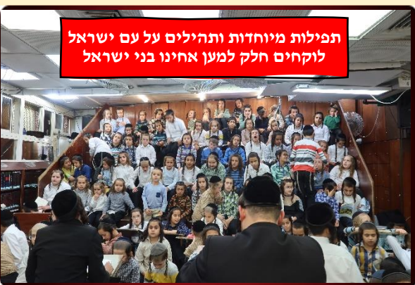
תפילות מיוחדות ותהילים על עם ישראל לוקחים חלק למען אחינו בני ישראל