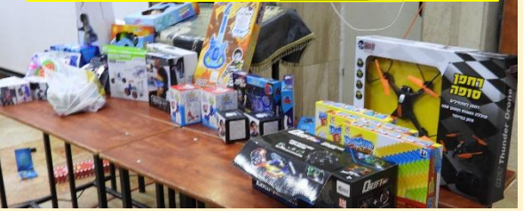
מסיבת חנוכה - נר שמיני של חנוכה - תשפ"ג