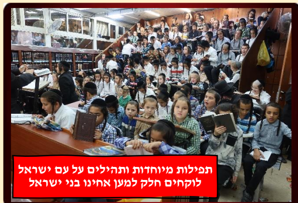
תפילות מיוחדות ותהילים על עם ישראל לוקחים חלק למען אחינו בני ישראל