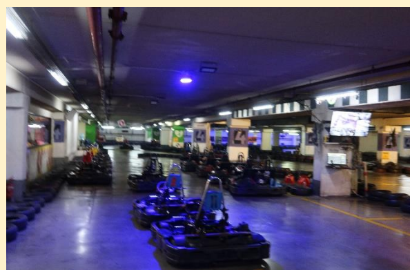
טיול מספר 14 – א' חשוון תשפ"ד