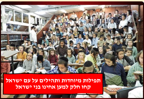
תפילות מיוחדות ותהילים על עם ישראל קחו חלק למען אחינו בני ישראל