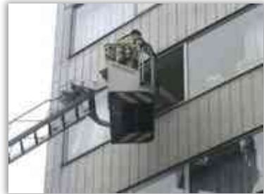
מורינו הרב במנוף

אחר כך, מורינו הרב סיפר, שבישעה שמיטתו הייתה קשורה למנוף והתנדדה באויר בא מלאך המוות, ומורינו הרב נלחם עמו וניצחו, ונשאר עמנו.