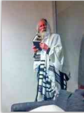
במסירת השיעור בלהבת אש

שיעור זה נאמר על ידי מורינו הרב בליל חמישי עשרה בטבת תשע"ה, ונאמר בשידור חי לארץ ישראל בזמן שהותו באמסטרדם שבהולנד.