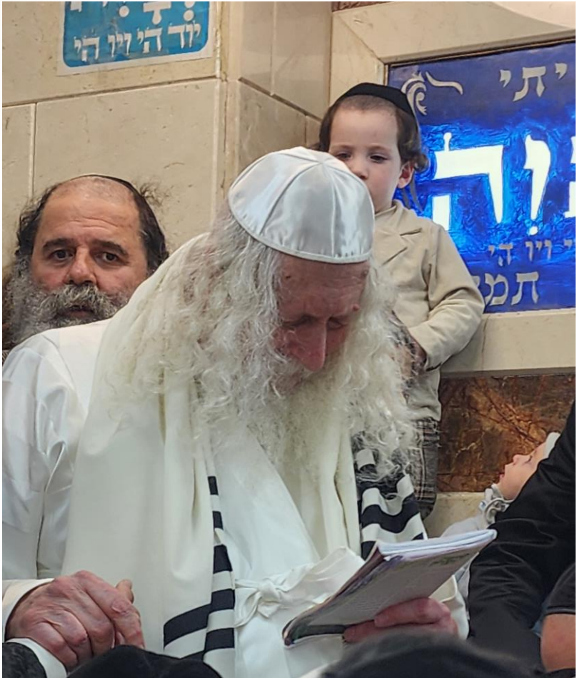
מורינו הרב קורא בגלין שביבי אור

לא ראיתי כזאת אמא, לגנוב את הבגדים של הילד? אני לא מבין דבר כזה. אז מה כתוב? באו 400 אלף איש שולף חרב? "ויצאו כל בני ישראל", כל בני ישראל באו בשביל אשה אחת, פה [במעשה דינה