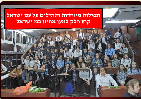
תפילות מיוחדות ותהילים על עם ישראל קחו חלק למען אחינו בני ישראל