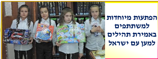
הפתעות מיוחדות למשתתפים באמירת תהילים למען עם ישראל

את מה צריך להרחיק בכל הליל? (לקוטי עצות) _____ _____ _____