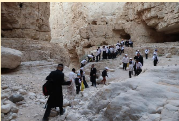
טיול מספר 3 – תשפ"ב