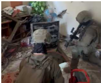
מנהרת חמאס שנחשפה מתחת למיטת ילדים בעזה