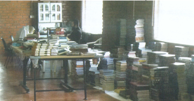
מורינו הרב שליט"א שוקד על תלמודו כשלצידו אלפי ספריו

ב' אלפים-תקכ"א ) אי אפשר לשער ולתאר מה שעבר על הצדיק בשנות גלותו שגלה עבור להמתיק דינים מעם ישראל שכידוע גלה ממדינה למדינה כמה שנים בתלאות וייסורי הגוף והנפש שאין לשער, ממרוקו לזימבבואה ומשם ליהנסבורג ומשם להולנד ושוב ליהנסבורג וכו' וכו' אפשר לכתוב ספרים שלמים רק על שנים אלו, ונעתיק קצת מגליון התחדשות שלאחרונה מסופר שם מקצת מן המקצת סיפורי נפלאות משנות הגלות, (העתק מגליון של חודש שבט) ... בבית הרב שליט"א דיבר בטלפון עם שנים מאנ"ש שטיפלו בספרים של הרב שליט"א שעוד נשארו במרוקו והרב הורה להם להביא את כל הספרים לזימבבואה באומרו שבינתיים הוא לא חוזר לאה"ק באותו זמן היו אצל הרב שליט"א רק חלק מהספרים ואלפיים נוספים אמורים היו להגיע בקונטיינר משליח מיוחד ... הרב שליט"א ממש שמח בכל ספר וספר שמגיע לו, בחדר של הרב היה חמש ארונות ספרים וכל הקירות רק מלאות ספרים ... ובכל פעם שהרב עבר ממקום למקום נסעו אחריו מספר משאיות שהובילו אלפי ספרים של הצדיק.