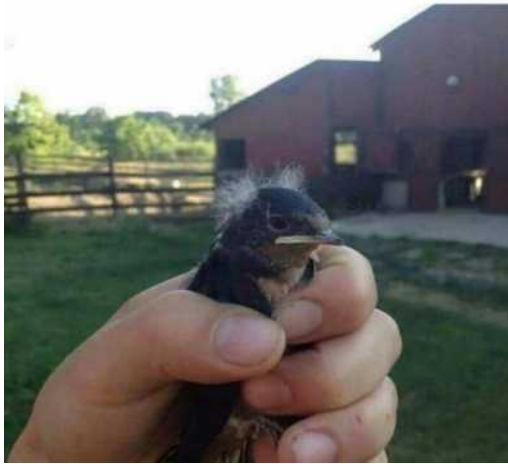
מסתבר שבן גוריון חזר בגלגול של יונה....

סיפור אמיתי!!! חייל דתי מסיירת מטכ"ל שחזר עכשיו מעזה מספר שבאחד הפשיטות שהם עשו לאחרונה בסג"יעה הם התמקמו באחד הבתים וערכו תפילת מנחה ותוך כדי התפילה הפתיע אותם בפתח הבית קשיש ערבי בן 70 שסיפר להם שהוא היה מסתערב ולפני 20 שנה הוא עבר תאונה והוא שכח בכלל מאיפה הוא בא ורק עכשיו שהוא שומע את תפילת המנחה הוא פתאום עף 20 שנה אחורה והזיכרון חזר אליו החזן שהיה ממוצא ספרדי התעצבן שמדברים באמצע התפילה תפס את הנשק שלו וירה בקשיש למוות מה שהתגלה אחר כך היה פשוט נס.... התברר שהקשיש היה ממומלךד כולו בחומר נפץ והוא רצה להתקרב לחיילים ולהפעיל את המטען אם החזן לא היה יורה בו הפיצוץ היה מוחק את כל הבניין תראו כמה חשוב לירות במי שמדבר באמצע התפילה