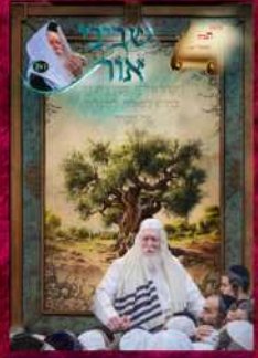
בשער: מורינו הרב סעודה שלישית פרשת תרומה