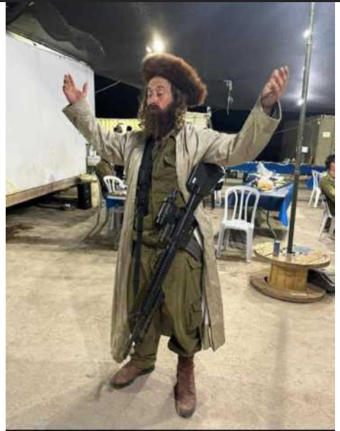
חשש כבד בנוער הגבעות בעקבות הצו של הנשיא ביידן: