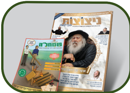
גדוש בתוכן עשיר מיוחד ובלעדי: מגזין ניצוצות המופץ בימים אלה

ראיון מיוחד נוסף שמתפרסם במגזין הינו ראיון מרטיט