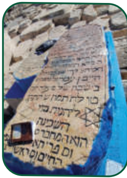
לא עובד יותר מכדי פרנסתו. קברו של "האור החיים הקדוש"

לא זהו העניין השיב האור החיים בשלווה, התנאי שרציתי להתנות עמכם הוא שאני עובד יותר משלש שעות בשבוע ולא משנה כמה אני מספיק ומהו הלחץ של הלקוח"